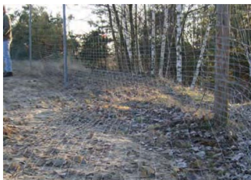
Jordafslutning ved hegn uden strøm